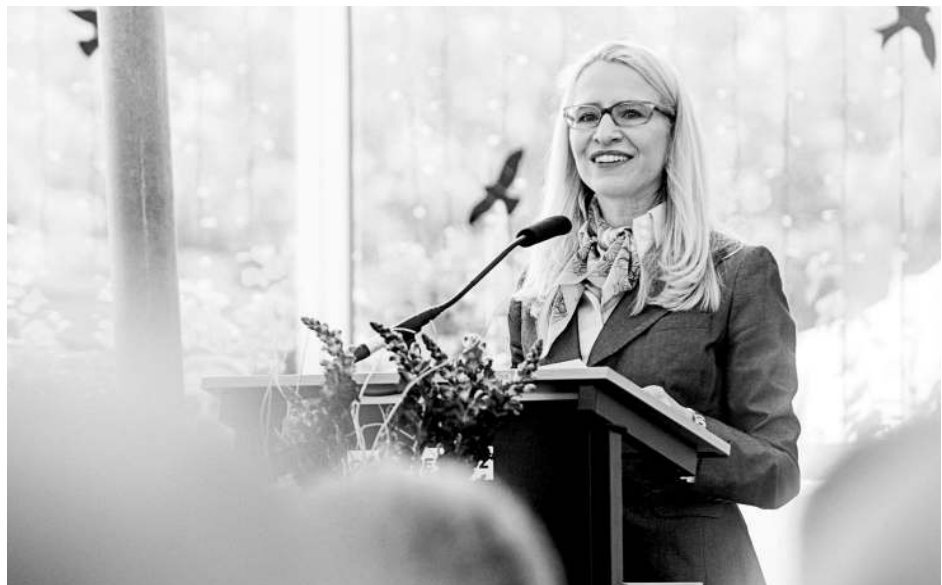
Kulturministerin Aurelia Frick überbrachte der jubelnden HMV die offizielle Gratulation der Regierung.

Für den traditionellen samstäglich Jugendmusiktag hatte sich die HMV etwas Neues einfallen lassen. Für die Nachwuchsmusikanten zwischen 10 und 16 Jahren standen fünf Workshops zur Auswahl, die von Chorgesang mit der Band Keaden über zwei Rhythmusworkshops mit Trash-Perussion auf Mülltonnen, al-