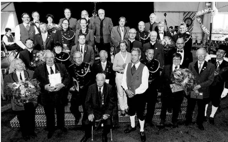
Fürstin Marie und LBV-Präsident Anton Gerner zusammen mit den Jubilaren des Blasmusikverbandes auf einen Blick.