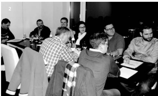
2 - 3 | Präsidentensitzung der Liechtensteiner Blasmusikvereine