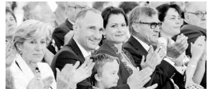
... und spendete zum Schluss viel Applaus für die Redner und vor allem auch für die gelungenen musikalischen Vorträge der HMV.