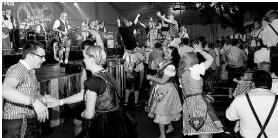
Beim Bayrischen Abend am Samstag mit der Oktoberfestband «Die Kirchdorfer» platze das Festzelt aus allen Nähten.