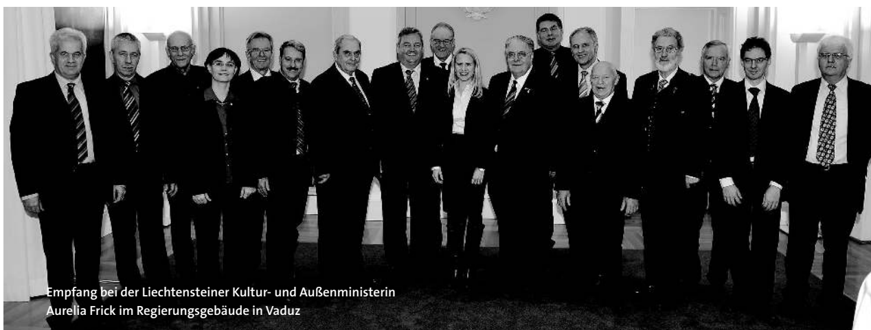
Empfang bei der Liechtensteiner Kultur- und Außenministerin Aurelia Frick im Regierungsgebäude in Vaduz