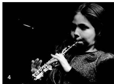
3-4 | Teilnehmer beim Preisträgerkonzert „Musizieren in Liechtenstein“

kern die Gelegenheit geben, eine ganz bestimmte Art von Bühnenerfahrung zu sammeln, den Stand ihres Könnens festzustellen und herauszufinden, welches Potenzial in ihnen steckt. Natürlich sind Wettbewerbe nicht das einzige Instrument dafür, aber sie sind ein sehr bedeut- und wirksames.