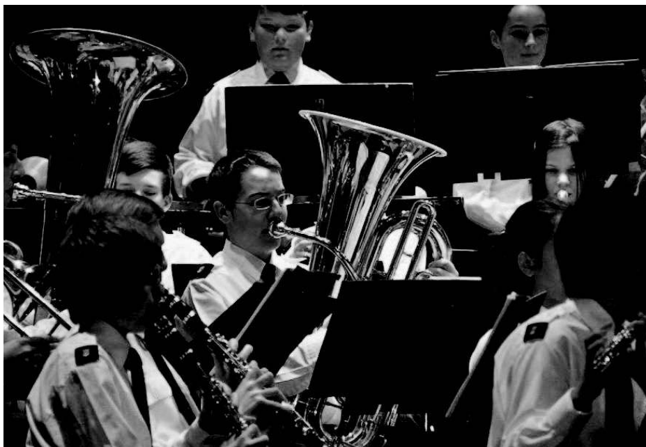
Tolle Chance: Unter Anleitung von Profimusikern der Wiener Symphoniker studieren die jungen Blasmusiker ein abwechslungsreiches Konzertprogramm ein, das am Sonntagvormittag im Rahmen der Bregenzer Festspiele zur Aufführung gelangt.