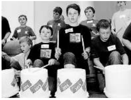
... vor allem auch der Trash-Perussion-Workshop mit Mülleimern ...