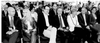
Das prominente Publikum mit Vertretern aus Regierung, Landtag und Gemeinden genoss die Feierstunde ...