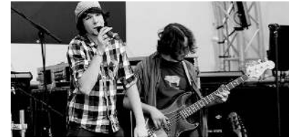
Auch etwas für die Jungen waren Konzertauftritte von Turpentine Moan (im Bild) und Keaden im LLB-Hof.