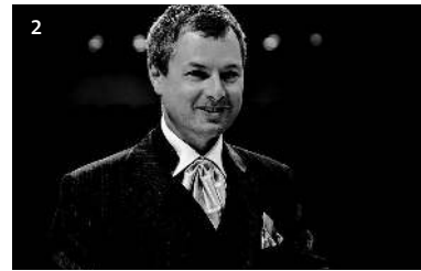
1 | Harmoniemusik Eschen