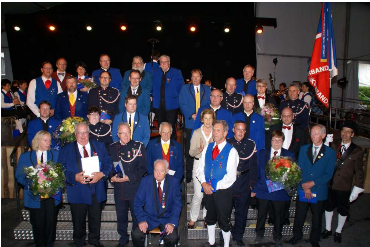
Jubilarenfoto vom 66. Liechtensteiner Verbandsmusikfest in Vaduz