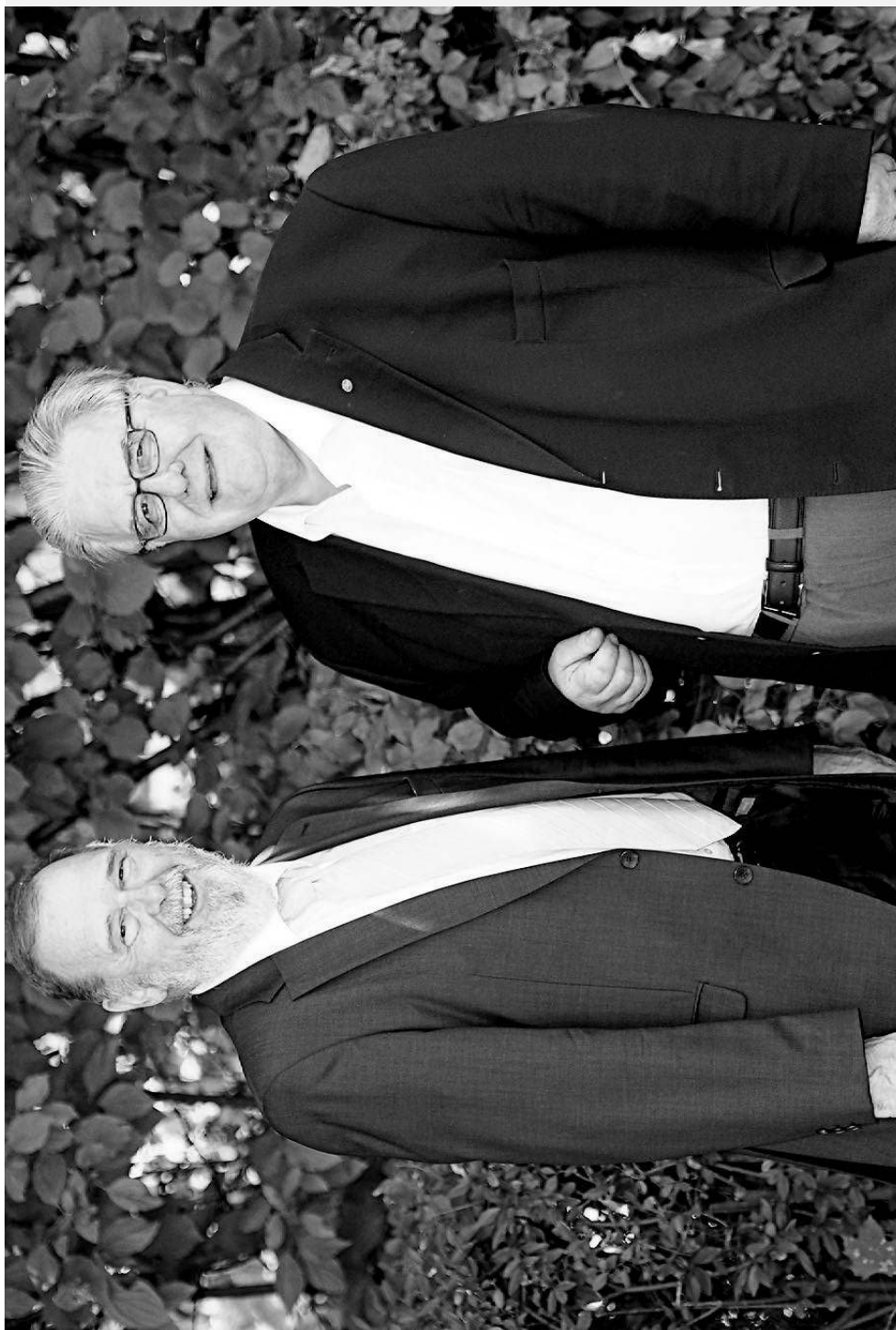
(Liecht. Volksblatt, 7.8.2013)

Weitere Informationen im Internet auf www.blasmusik.li