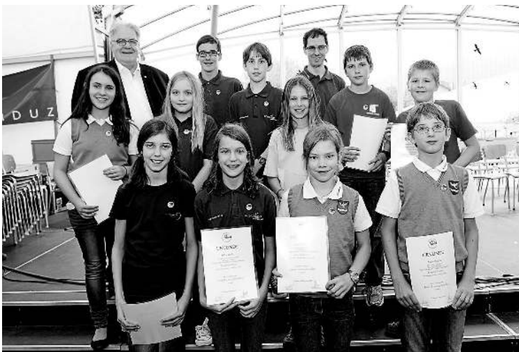
Erfolgreich bestanden: Die jüngsten Nachwuchsmusikantinnen und -musikanten mit dem Juniorabzeichen.