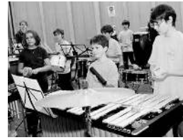
... unter dem Applaus des Publikums auf dem Rathausplatz präsentieren.