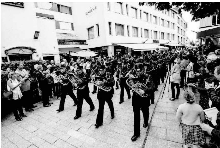
Geburtstagsmarsch: Die Harmoniemusik Vaduz feierte am diesjährigen Verbandsmusikfest ihr 150-Jahre-Jubiläum mit vielfältigem Programm.