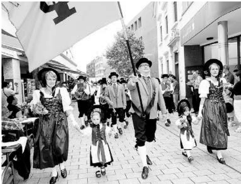
Zuvor ging es mit klingendem Spiel vom Vaduzer Rathausplatz zum Auftakt des 66. Liechtensteiner Verbandsmusikfests.

sich an diesem Wochenende rund 1000 Musikantinnen und Musikanten aus drei Ländern in Vaduz versammelten. Sein Gruss galt den Musikanten aus den zehn Verbandskapellen des Landes und Blasmusikvertretern aus der ganzen Region.