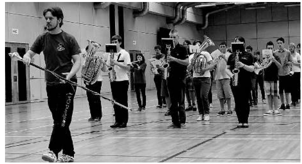
... oder in Parademarschmusik (Leitung: David Eiermann), bei der eine kurze Show einstudiert wurde, teilnehmen. Es machte allen sichtlich Spass...