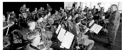
Im Anschluss an den offiziellen Festakt «150 Jahre HMV» begeisterte die Gardemusik Wien beim Frühschoppen im Festzelt mit einem schmissigen Programm.