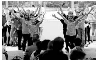
... und am Samstagnachmittag konnten die Jungen dann ihre Workshop-Ergebnisse ...