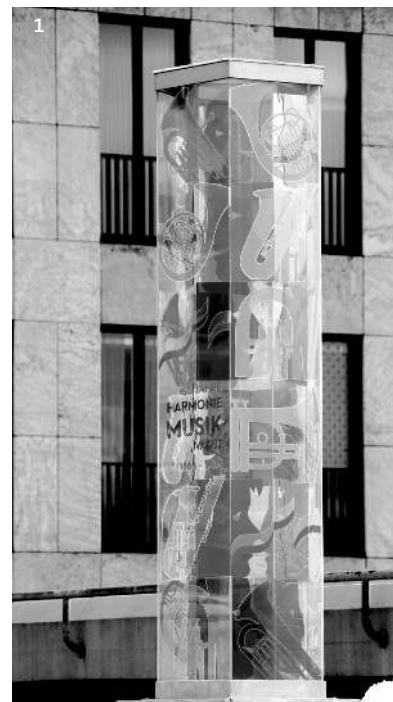
1 | 150-jähriges Bestehen der Harmoniemusik Vaduz