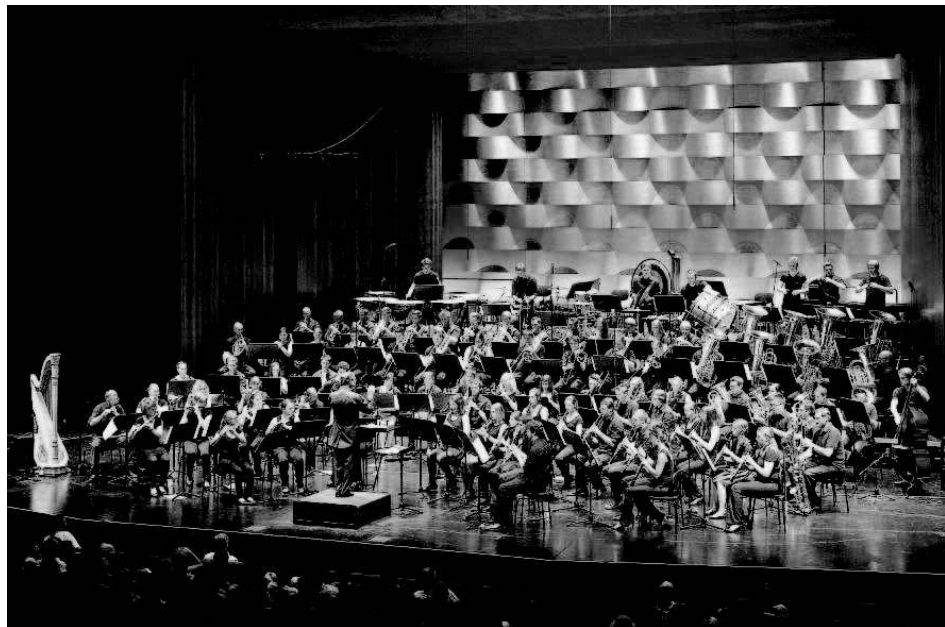
Tolles Abschlusskonzert: Im Festspielhaus Bregenz konnten die jungen Musiker, darunter auch sechs Liechtensteiner, präsentieren, was sie während des Camps gelernt hatten.