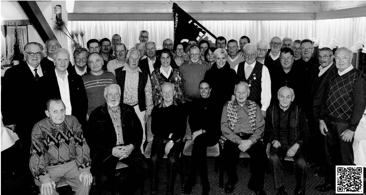
Bei der kleinen Feierstunde des Blasmusikverbands fanden sich die Verbandsjubilare sowie zahlreiche Ehrenmitglieder ein.