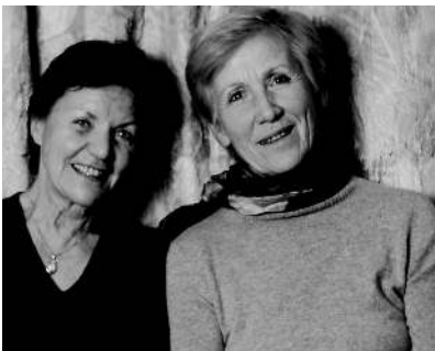
1 | Die ersten Musikantinnen damals