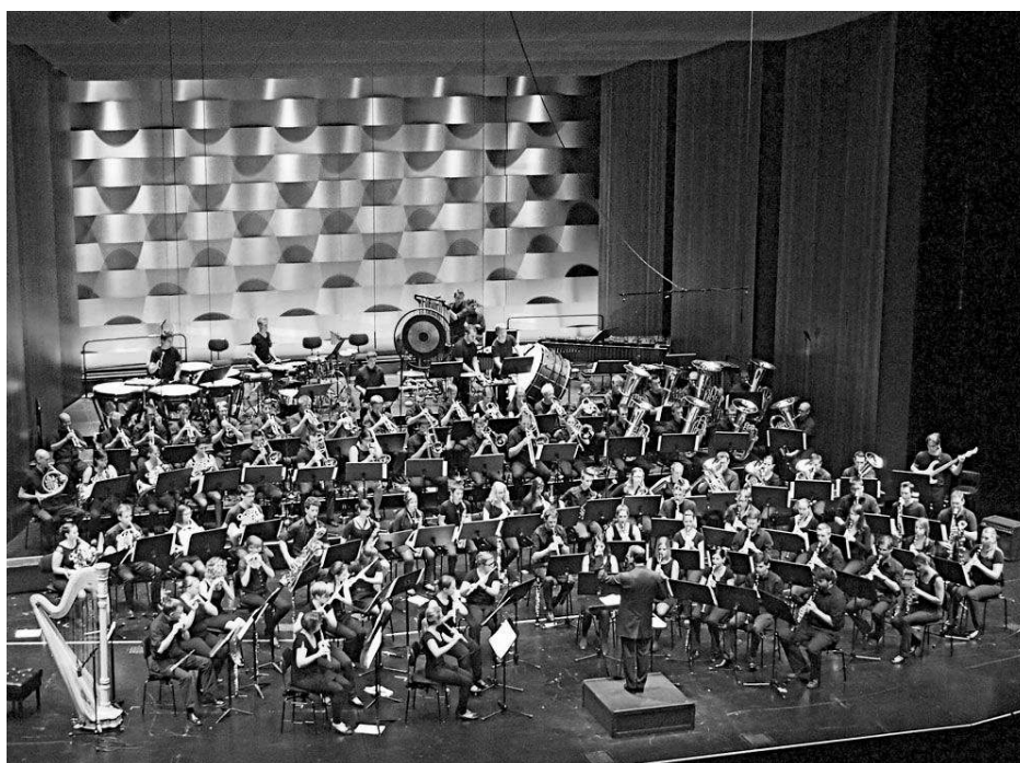
Das junge Orchester begeisterte mit gut ausbalanciertem Klang, viel Energie, Können und Spielfreude.