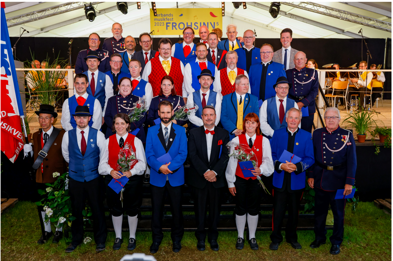
Jubilarenfoto vom 74. Liechtensteiner Verbandsmusikfest in Ruggell