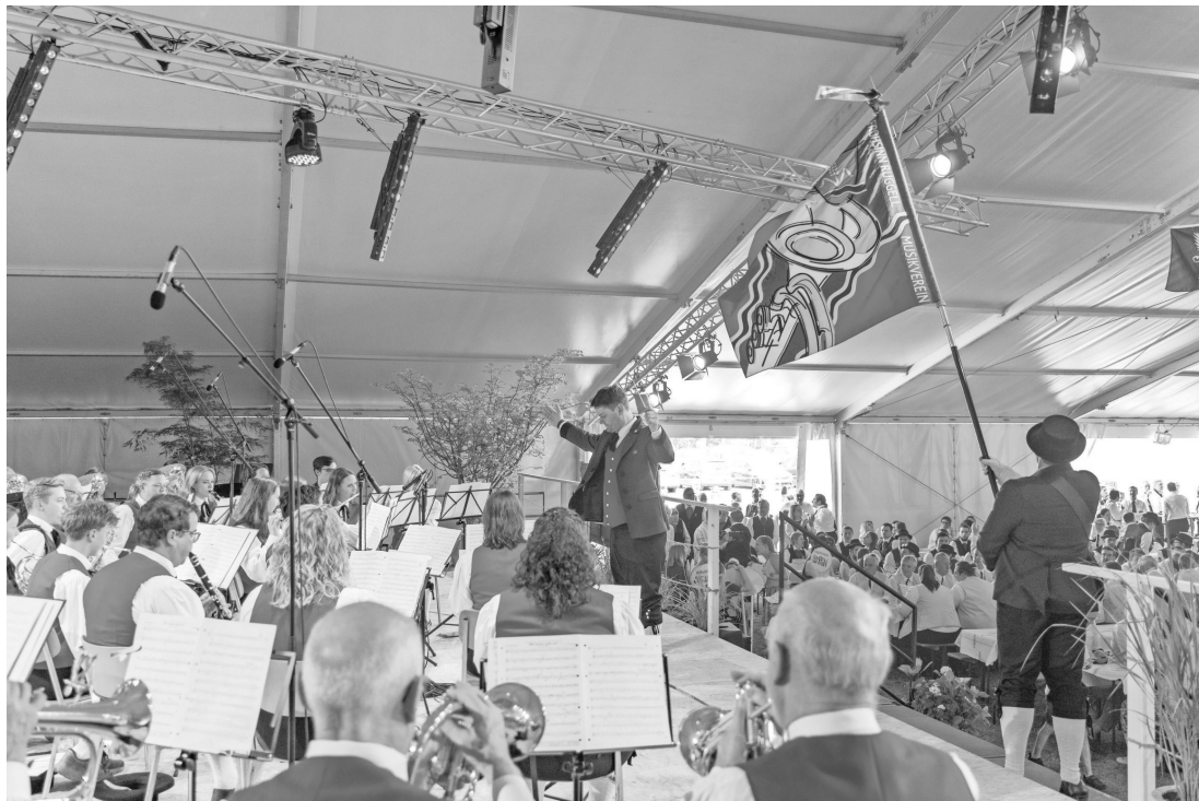
Am 74. Verbandsmusikfest in Ruggell wurde wieder drei Tage lang das Musizieren in all seinen Facetten gefeiert.

Im Anschluss folgten die musikalischen Vorträge der Vereine