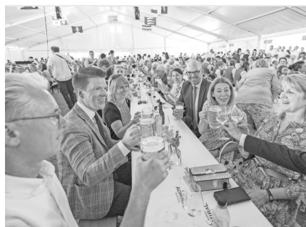
Am Ehrentisch versammelte sich das «Who is Who» der Politik.