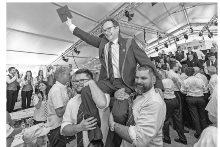
Die Jubilare wurden ordentlich gefeiert.