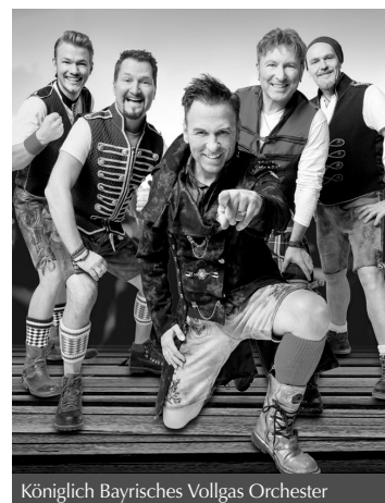
Königlich Bayrisches Vollgas Orchester

Der Verbandstag „Alli met FROHSINN“ (25. Juni) beginnt um 9 Uhr bei Kaffee und Gratis-Gipfile. Ab 9.30 Uhr findet die vom Musikverein Feldkirch-Nofels musikalisch umrahmte Zeltmesse statt. Danach spielt er bei einem Frühschoppen auf. Ab 13 Uhr gibt es