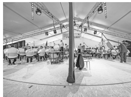
Ein Highlight des Festes war die Drehbühne.