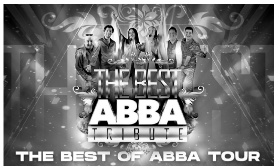
THE BEST OF ABBA TOUR