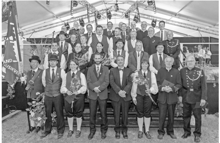
Insgesamt wurden 30 Jubilare am 74. Verbandsmusikfest in Ruggell geehrt.